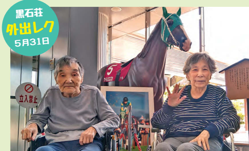
黒石荘 外出レク 5月31日

この日はレースの予想をたてたり、武豊さんが騎乗して活躍した馬、サイレンススズカ像の前で記念撮影したりして皆さん、競馬場を楽しんでいました。