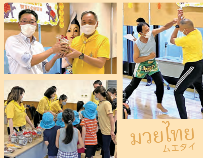
มวยไทย ムエタイ

約2時間の交流会でしたが、タイのお国柄である明るい人柄と雰囲気、利用者様も園児も大いに盛り上がり楽しまれて大変素敵な交流会となりました。